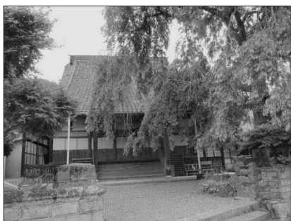
法成寺跡

また、広島地方においても、廃寺もしくは活動を停止している寺院の多くに共通点を見出すことができる。それは、廃寺に至る寺院の多くが、自らの檀家を持つことなく「けきょう」を中心に経営を行う寺院であるということである。けきょうとは、檀家が所属する「師匠寺」が遠方であり参拝することが困難なため、檀家の籍は師匠寺においたまま、自宅近所の寺院に法要などを依頼する体制のことである。そのため、近隣住民への勤行を主な活動とし、自らの檀家を持たない寺院も数多く存在する。広島地方の寺院では、この檀家でない近隣地域の住民のことを「預かり門徒」と呼んでいる。