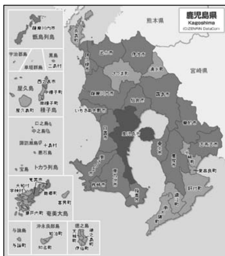
鹿児島市町村図

このようにみていくと、鹿児島県の廃寺の要因として、ひとつには過疎の問題を否定することはできない。崎山地区、木津志地区ともに過疎地域であり、今後人口の増加が簡単に望める地域ではない。しかし、現在においても崎山地区99世帯、木津志地区64世帯あることから考えて、厳しい寺院経営が予想されるものの、決して経営できない状況とはいえない。実際、鹿児島県南さつま市の秋目地区にある正法寺は、同地区が人口112名、世帯数67戸 31 の中、経営されている。そう考えると過疎のみを唯一の要因と捉えることは出来ない。またその他の要因として、所属寺院より遠方であったため建立された出張所がその役割を失ったための廃寺であったとも考えられる。設立当初は、所属寺までの距離が遠かったための出張所であったが、その後の交通機関の発達、マイカーの普及などによって、その必要性がなくなったものともいえる。しかし、設立の目的は出張所であったとしても、地域住民の意思によって独立を果たし維持してきた寺院を易々と、その目的を終えたということだけで、廃寺にできるとは考えにくい。加えて、鹿児島県の2つの事例には、住職の後継者が不在だったことが大きな要因であったといえる。崎山説教所の住職には子どもがなく、外部から招聘することもなかった。また、光泉寺住職には子どもがいたが、住職を継ぐ意志がなく後継者不在となった。もちろん、過疎による今後の寺院経営に懸念を持ったための後継者不在だったとも考えられる。しかし、なにかしらの方策を持って後継者を指名し、住職継承がうまく進んでいれば、結果は違ったものであったとも思われる。