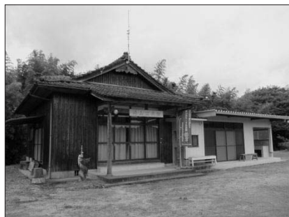
崎山説教所跡

崎山説教所と光泉寺は、その設立に共通点を見いだせる。それは、崎山説教所と光泉寺は共に番役によって設立された寺院であるということである。「番役」とは県内各地で呼ばれる呼び名であり、寺院から遠方の地域で、寺院へ参拝する不便さから法要などを僧侶に変わり執り行っていた者の呼び名である。主な役割は、地域で死者がでた場合の枕経、通夜、中陰法要な